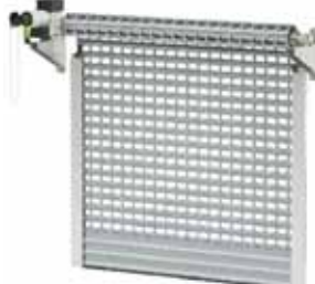
BKR / KNS