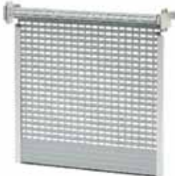
BKR / KNB